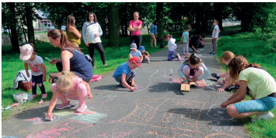
Hravá odpoledne jsou oblíbená nejen dětmi, ale i jejich maminkami

Rok 2024 byl pro informační centrum obdobím plným aktivit a změn, které pomohly zpřístupnit informace a služby pro širokou veřejnost. Návštěvníci centra, ať už místní obyvatelé nebo turisté, se mohli těšit z novinek a vylepšení, které obohatily nabídku tohoto informačního bodu v srdci města. Jedním z klíčových trendů v roce 2024 byl rostoucí zájem o turistické informace a služby, které informační centrum nabízí. S přílivem turistů, zejména během letní sezony, se centrum stalo významným zdrojem informací o turistických cílech v okolí Nýrska. Kromě tradičních brožur a map si návštěvníci mohli také zakoupit mnoho nových suvenýrů s logem Nýrska. Náš sortiment se rozrostl například o nové cestovní hrnky a plecháčky, tašky, zápisníčky, propisky a mnoho dalšího. Velké oblibě se těšila i plyšová zvířátka se šátečky s logem města. Celý rok jsme úzce spolupracovali s oběma základními školami. Každý měsíc chodili do informačního centra