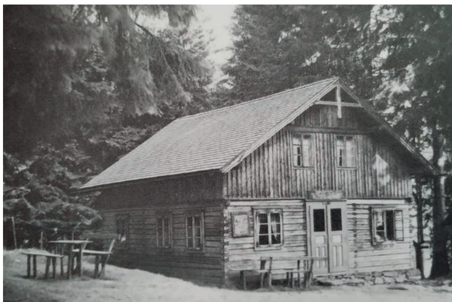
Chalupa „Stateček“ sloužila až do června roku 1945, opuštěna časem chátrala

Na chatě nikdy nebyla elektrina, proud vyráběl diesellový agregát umístěný ve sklepě. A tak šel rok za rokem, turisté přicházeli a odcházeli se zážitky prožité na hřebenu těchto hor. Někteří odjížděli v létě a na podzim s nasušenými houbami či košíky borůvek či brusinek. Na Můstku byla vyhlášena brusinková plantáž. Vše tyto možnosti, tj. výhledy z rozhledny na protější hřeben a do Úhlavského údolí nebo pohled na západ slunce