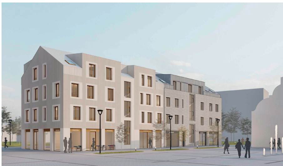
Předběžná vizualizace bytového domu na náměstí

V současné době mimo jiné probíhá také kontrola technického stavu místních komunikací. Do konce června letošního roku budou provedeny opravy výtluků a míst, které vyžadují pokládku asfaltových vrstev. V dalším čísle Nýrských novin zveřejníme seznam míst, kde budou tyto opravy prováděny. Zároveň bude provedena částečná oprava chodníku vedoucího od parku u Okuly ke koupališti, protože zde začínají postupem času kořeny vzrostlých stromů zvedat jak asfaltový povrch, tak následnou zámkovou dlažbu. A tak v podzimních měsících letošního roku dojde k technickým úpravám, položení nového asfaltu a srovnání zámkové dlažby tak, aby daný úsek neomezoval chodce.