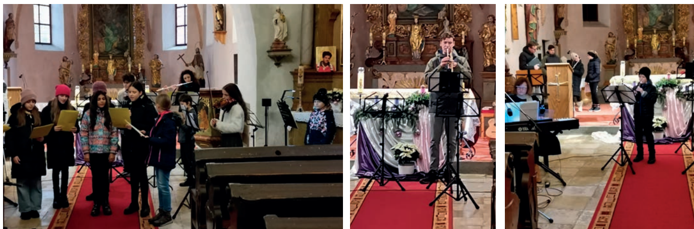
Adventní koncert žáků ZUŠ Hanuše Steina v kostele sv. Tomáše v Nýrsku

Tak jako každý rok připravila Základní umělecká škola Hanuše Steina pro předvánoční a adventní čas celou řadu akcí pro širokou veřejnost nejen v Nýrsku, ale také v Janovicích nad Úhlavou a Železném Rudě. Pravidelné třídní koncerty jednotlivých učitelů doplnily společné koncerty jednotlivých oddělení. 10. prosince přivítali návštěvníky žáci houslového a klavírního oddělení na svém koncertu a druhý