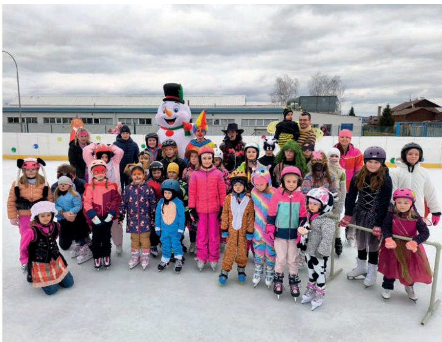
Karneval na ledě v roce 2024

Již tradičně se připojujeme k Noci s Andersenem. Smyslem této akce je podpořit dětské čtenářství, pomoci dětem pochopit, že knihovna je „kouzelné“ místo a že čtení může být zábava. Vyrázili jsme na hrad Pajrek, cestou jsme plnili řadu úkolů, našli