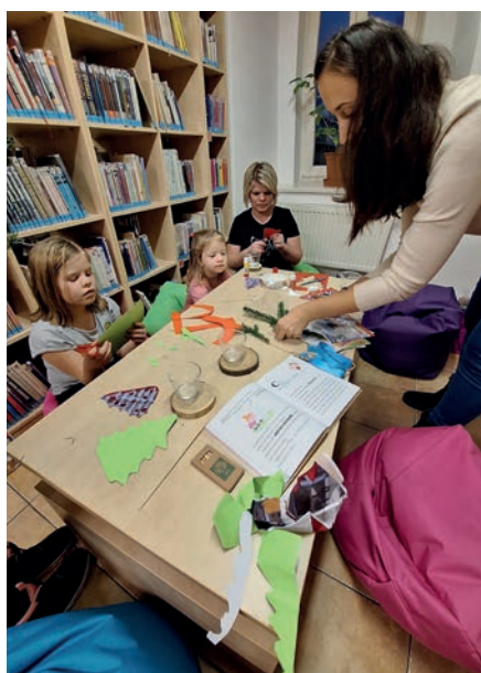
Vyrábění s dětmi při adventním čtení

Aby měla knihovna budoucnost, věnujeme se mladé generaci. Kromě půjčování her a zajímavých interaktivních knih pořádáme knihovnické lekce pro mateřské školy a první stupeň obou základních škol. Jedná se o zhruba hodinový program pro každou třídu, jehož cílem je vzbudit v dětech zájem o četbu knih a seznámit je s prostory a činností knihovny. Minulý rok proběhlo cca třicet lekcí, které jsou koncipovány tak, aby byly pro děti zajímavé a ty se musely aktivně zapojit.