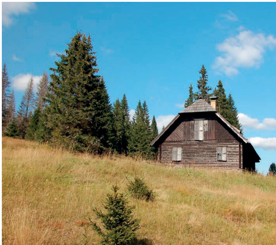
Roklanská chata zde stojí dodnes (na rozdíl od Roklanské hájenky)

A jak je to s KČST v Sušici? V soupisu majetku KČST je vedeno vlastnictví parcely 1330/9 u rokclanské jímky, která se nachází před křižovatkou cesty vedoucí od Březníku a cesty souběžné s Roklanským potokem vedoucí k soutoku s Rokytkou. Hodnota pozemku v té době činila 300 Kč. Dá se předpokládat, že klub měl v úmyslu zde turistickou chatu postavit, ale k realizaci už nedošlo. Také je možné, že měl klub některý z objektů (Roklanská hájenka a Roklanská chata) v nájmu na krátkou dobu po 2. světové válce. Prozatím se žádný doklad neobjevil. A jaká byla historie Roklanské chaty po válce? Jak Roklanská hájenka, tak i chata nebyly po roce 1945 osídleny a jejich činnost byla časem ukončena. Po únoru 1948 a se vznikem hraničního pásma je situace jiná. Roklanská hájenka chátrá a je napadena dřevomorkou a je tak údajně pohraničníky zbourána. Mladší sestra, Roklanská chata, odolává, je zdravější, stojí teprve 10 let. V roce 1951 se stává součástí pohraničního pásma a chatu obývají strážci hranic. V chatě jsou kanceláře velitele roty Roklan a koňské stáje. Slouží do roku 1963, kdy rota byla zrušena. Chata je využívána jako