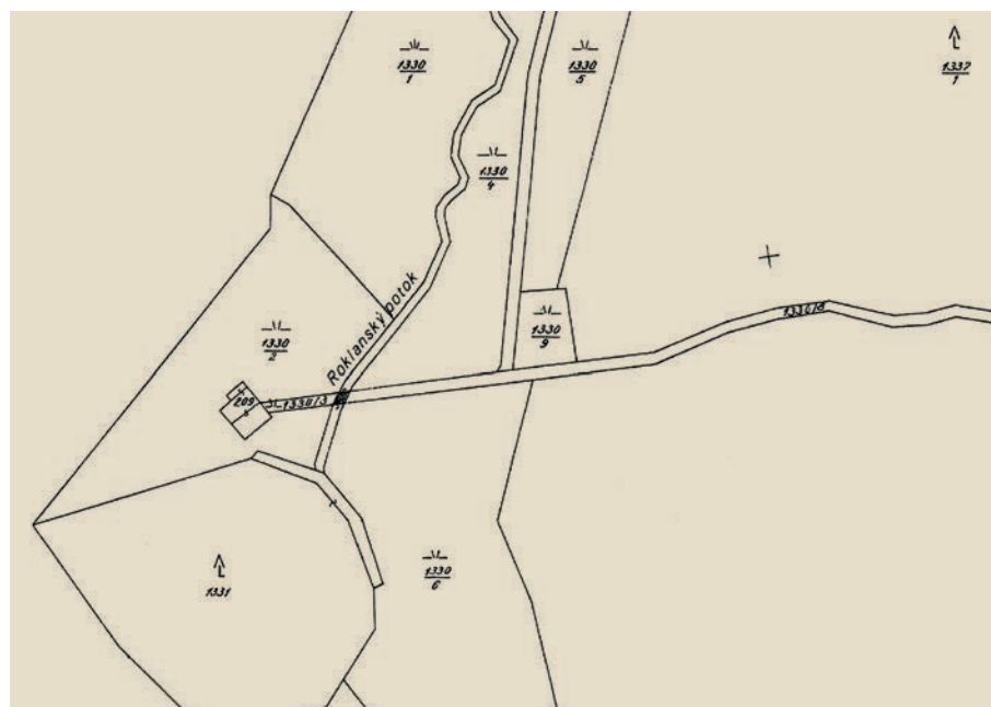
Mapa evidence nemovitostí z let 1961-1983

Dnes je celé území Modravských slatí od hranice až po Roklanský a Javoří potok uzavřeno až do roku 2025 s omezeným vstupem. Dostanete se sem jenom s průvodcem. Vstup organizuje NP Šumava, a to 2× do roka v letním období s max. počtem 12 osob/akce a zaplatíte asi 500 Kč. Registrace je přes internet, první den začíná od 9.00. Zkuste to, já se o to pokoušel třikrát v 9.02, a neměl jsem šanci - obsazeno! Něco je ve vzduchu, a nejsou to jen ptáci! Ostatní návštěvníci chodí jinudy a jindy, porušují zákon NP Šumava. Ještě tak