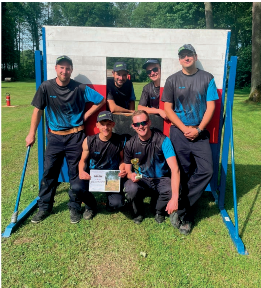
Tým SDH Hodousice na soutěži v Bystřici nad Úhlavou

zúčastnilo 7 týmů. Srpnová pouťová zábava s kapelou RELAX se vydařila a na letošní rok máme domluvenou novou hudební skupinu.