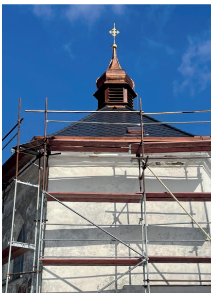
Původní a současný stav kaple