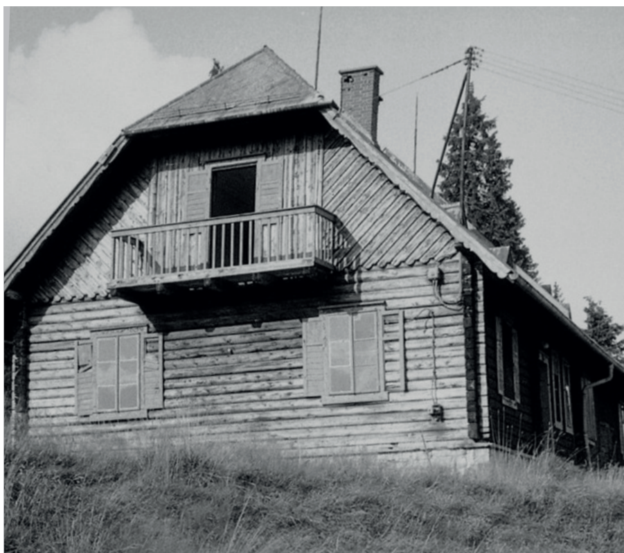
8. června 1935 bylo vydáno stavební povolení ke stavbě Roklanské chaty

předáno 14. června 1935 a zároveň 95 kubiků měkké kulatiny. I v této době dochází od stavitele upozornění na vícepráce. ŘSLS se zdráhá platit. Po těchto nepříjemnostech je stavba dne 26. 9. 1935 dokončena. Stavitel Houra žádá o její kolaudaci co nejdříve, dokud to povětrnostní poměry dovolí. Okresní úřad v Sušici má však asi dost času, a tak až 19. 11. 1935 se dostaví na místo odborná komise a konstatují, že práce je odborně provedena a bylo použito