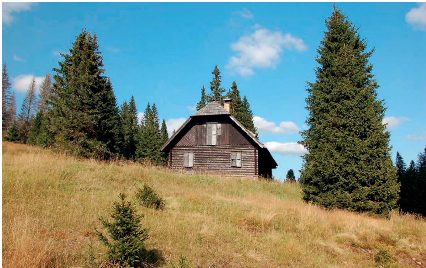
Hájenska byla zbourána v roce 1951. Přípomínkou starých časů zůstává už jen Roklanská chata, která stojí dodnes