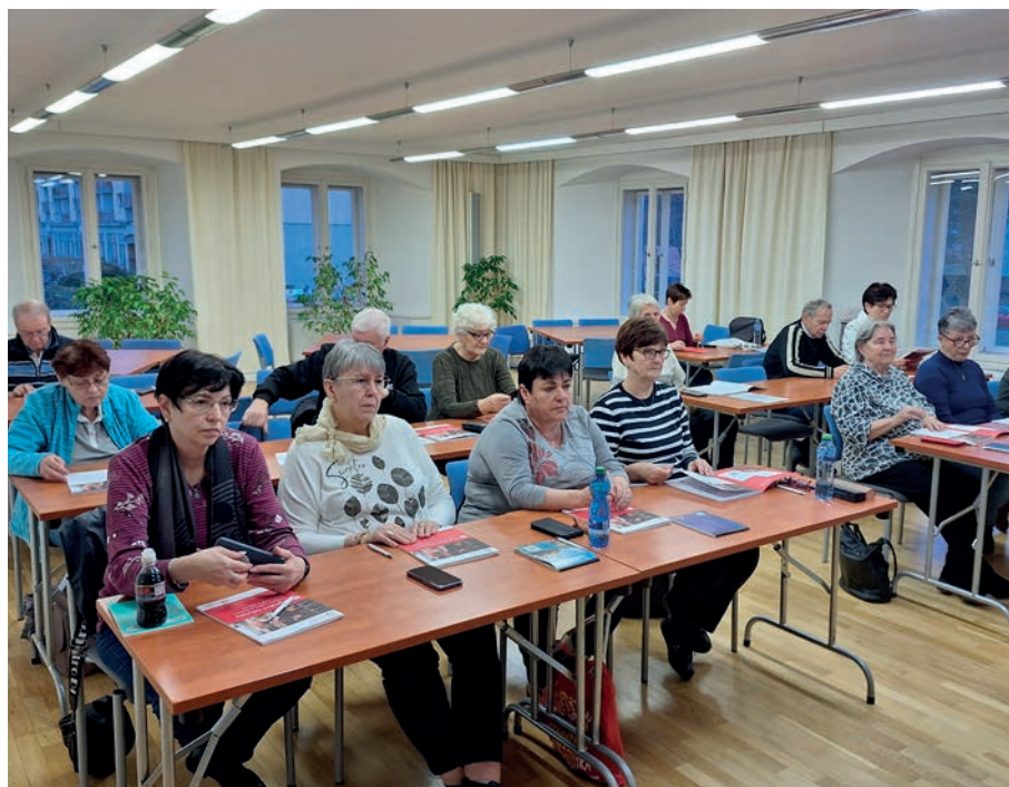
Kapacita semináře byla naplněna do posledního místa

účastníci zmiňovaného semináře „Jak na chytrý telefon...“ měli chuť a vůli rozšířit si své poznatky ve využívání IT technologií. Je na místě vyslovit velkou pochvalu