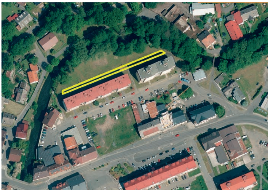
Výstavba jednosměrné komunikace a parkovacích ploch za Rybářskou ulicí

V letošním roce dojde k realizaci nové fontány před kulturním domem, která nahradí stávající nefunkční kašnu. Původní kašna bude odstraněna a na jejím místě vznikne moderní fontána s novými technologiemi. Stavba je rozdělena na dvě hlavní části –