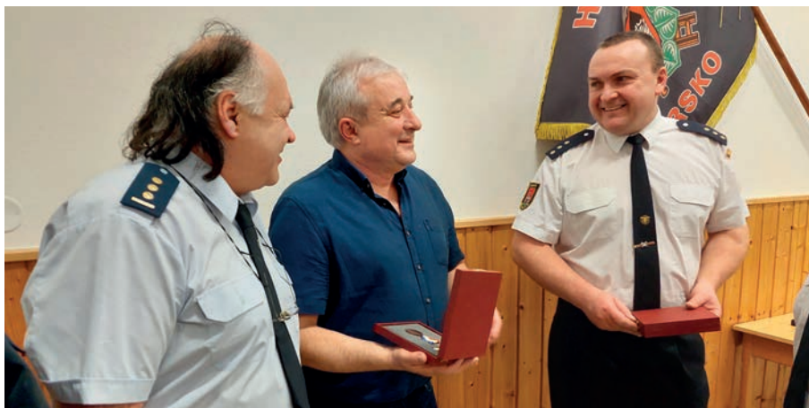
Starosta města obdržel ocenění za dlouholetou spolupráci s hasiči a jejich podporu