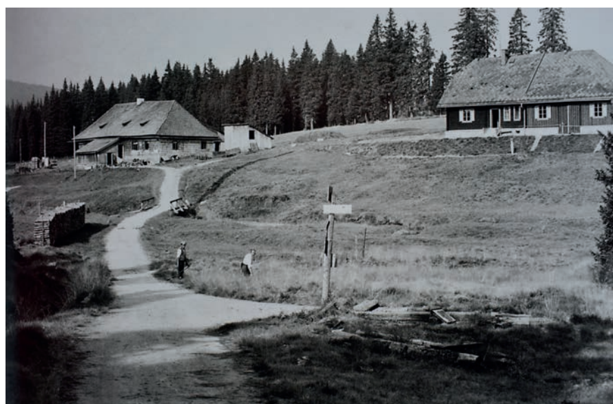
Roklanská hájenka s Roklanskou chatou