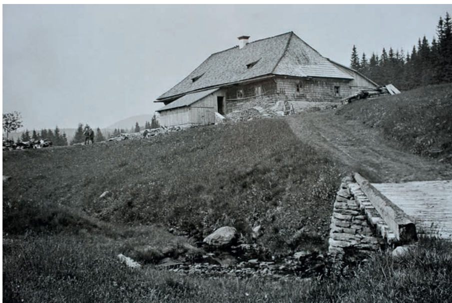
Roklanská hájenka v roce 1920