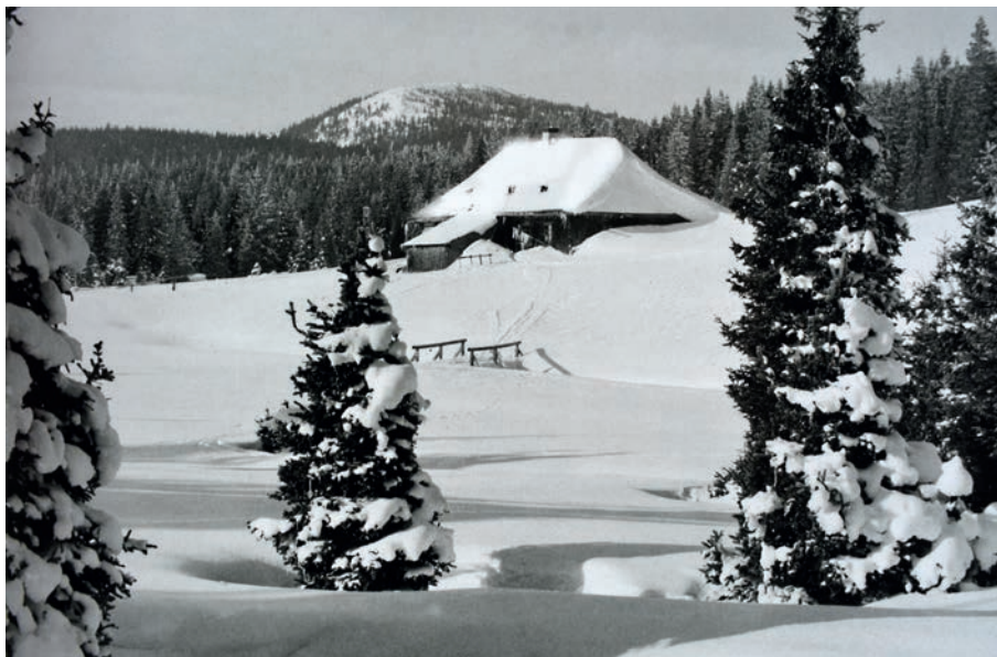
Roklanská hájenka v zimě roku 1928