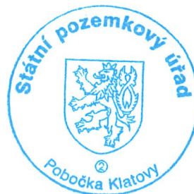
Ing. Zbyněk Weber vedoucí Pobočky Klatovy Státní pozemkový úřad

Současně pozemkový úřad doručuje toto rozhodnutí všem účastníkům řízení. Do tohoto rozhodnutí se všemi přílohami lze v souladu s ust. § 11 odst. 5 zákona po dobu uveřejnění této veřejné vyhlášky, to je po dobu 15 dnů nahlédnout na Městském úřadu Nýrsko na adrese: Náměstí 122, 340 22 Nýrsko nebo na pozemkovém úřadu na adrese: Čapkova 127, Klatovy V, 339 01 Klatovy, a to nejlépe po předchozí telefonické či e-mailové domluvě, viz záhlaví dokumentu.